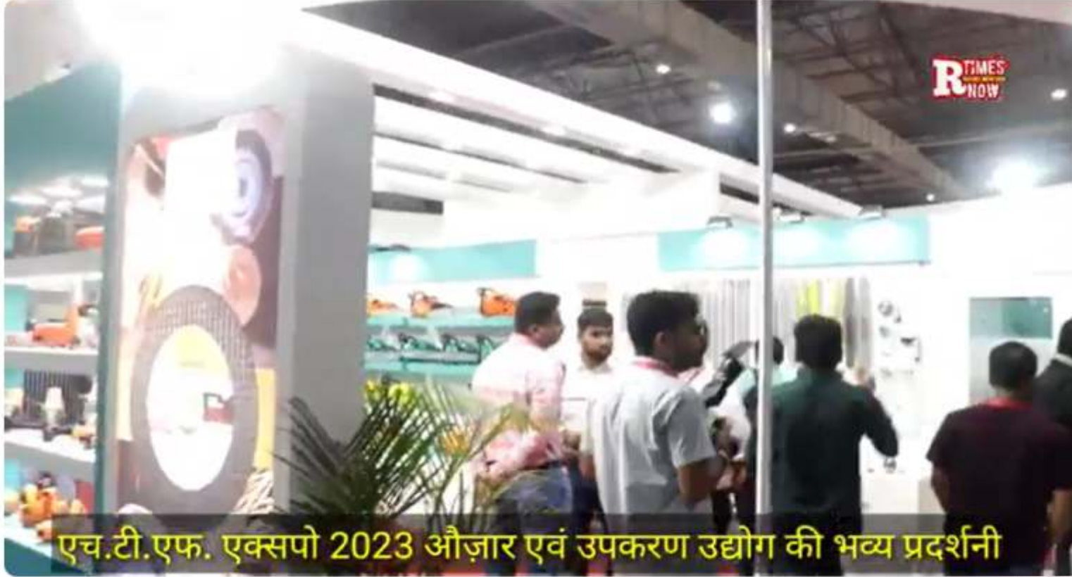
एच.टी.एफ. एक्सपो 2023 औजार एवं उपकरण उद्योग की भव्य प्रदर्शनी